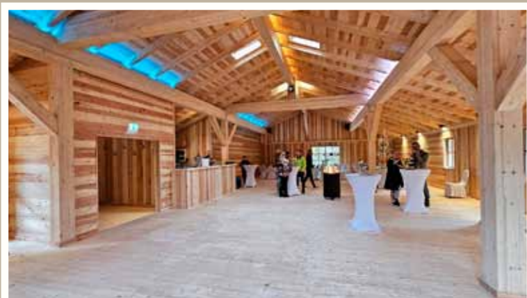
Die sehr geräumige und lichtdurchflutete „Alm“ ist für Familienfeste und Firmenfeiern bis zu 120 Personen geeignet.