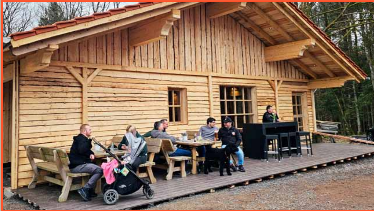
Die neue Almhütte wurde beim Tag der offenen Tür interessierten Gästen außen und innen vorgestellt.