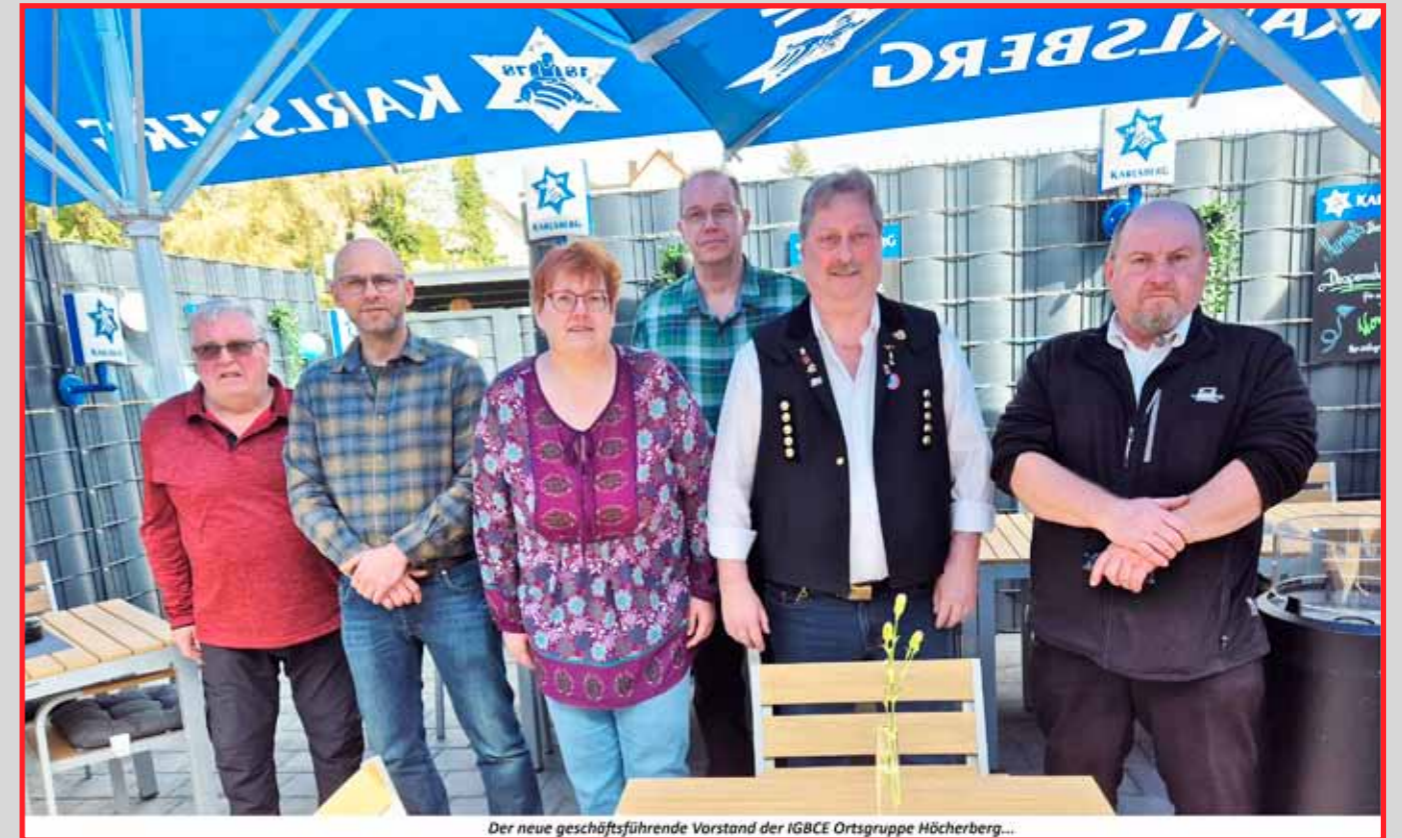
Der neue geschäftsführende Vorstand der IGBCE Ortsgruppe Höcherberg...

Tel. 06841-9800954 www.dachdeckerei-knoebl.de