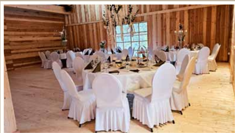
Für Hochzeitsfeiern sind die Tische und Stühle bereits vorbereitet. Es fehlen nur noch Brautpaar und Gäste.

Nach monatelanger Bauzeit durch ein darauf spezialisiertes Holzbau-Unternehmen steht die neue Almhütte neben Turm und Höcherberghaus kurz vor ihrer Vollendung. Am 16. März konnten interessierte Gäste im Rahmen eines Tages der offenen Tür auch das Innere des neuen Gebäudes kennenlernen, das vom Fußboden bis zum Dach aus Holz erbaut und mit roten Tonziegeln gedeckt ist. Am Ostersonntag (31. März 2024) wurden in der Alm erstmals Gäste bewirtet.