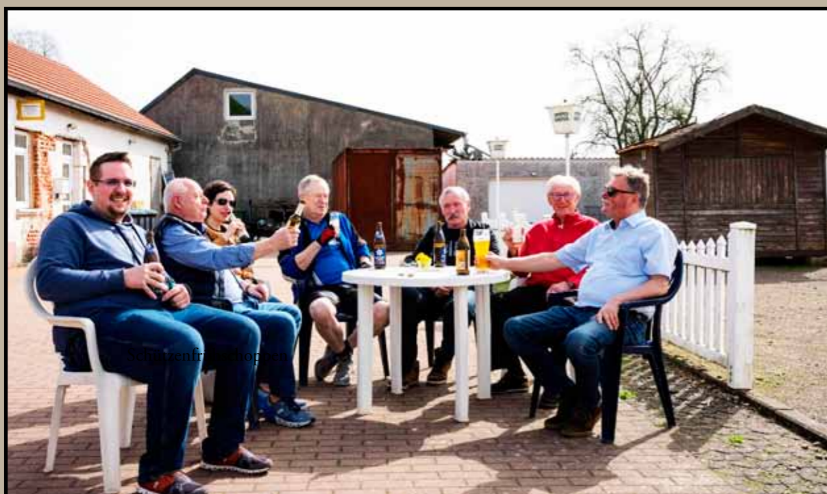
Schützenfrühschoppen am Sonntagmorgen

Hier nochmal alle Öffnungszeiten im Schützenhaus Sonntagsfrühschoppen ab 10Uhr bis 13Uhr und zu den Trainingszeiten Dienstag und Freitag Jeweils von 19Uhr bis 21Uhr